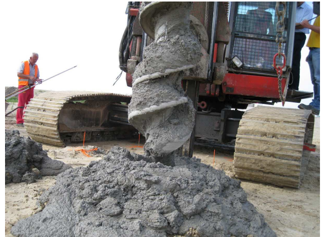
Abb. 2: Herstellung der CMC-Säulen, DYNIV, als tiefreichende Bodenstabilisierung

Nach Herstellung von Probesäulen unterschiedlichen Typs und nach dem Ausschreibungsverfahren wurde eine tiefreichende Bodenstabilisierung System CMC-Baugrundverbesserung der Firma DYNIV durchgeführt.