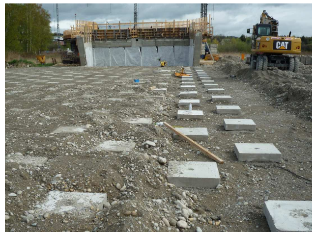
Abb. 3: Planum mit Säulen Kopfplatten für die Herstellung der Tragplatte aus verfestigtem Boden